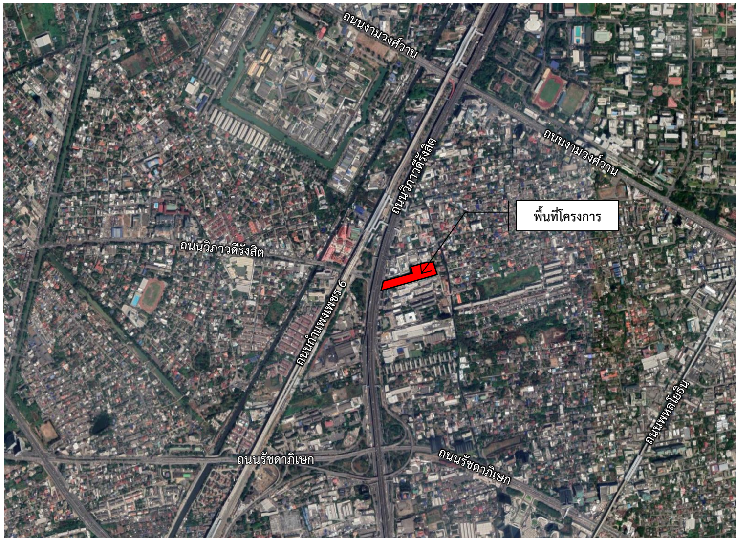
รูปที่ 1.2-1 แสดงตำแหน่งที่ตั้งโครงการ