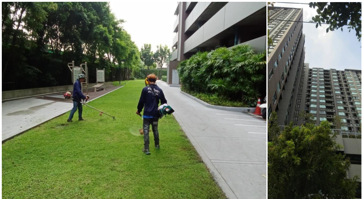
รูปที่ 1.4-1 แสดงสถานภาพปัจจุบันของโครงการ (ช่วงเดือนกรกฎาคม - ธันวาคม 2566)